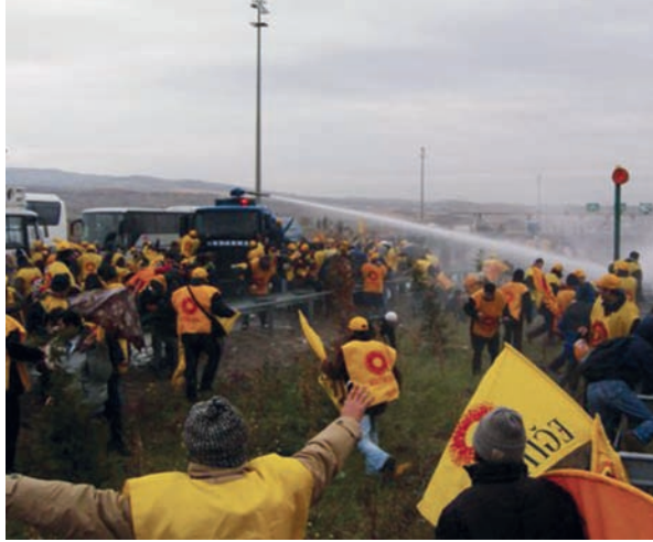
KESK'in eylem takviminin eksiklerini ve yetersizliklerini gidermek için...

25 Kasım'ın kitlesel bir takım eylemlerle güçlendirilmeye çalışılması, taleplerin gündemleştirilmesi anlamlıdır. Ancak yeterli değildir. Şubelere gönderilen yazıda da belirtildiği gibi temel sorun 25 Kasım'ın bir süreç olarak örgütlenmesidir. KESK, sürece ilişkin "Süreç her atılan adımda coşkun ve katılımın bir öncekinden daha güçlü olacağı bir biçimde örgütlenmeli, 'Hak verilmez alınır!' şiarı etrafında örgütlü-örgütsüz bütün kamu emekçilerinin greve katılımını sağlayacak bir perspektif çalışmalarına hakim kılınmalıdır" demektedir. Ancak pratikte bunun nasıl sağlanacağı boşlukta kalmaktadır.